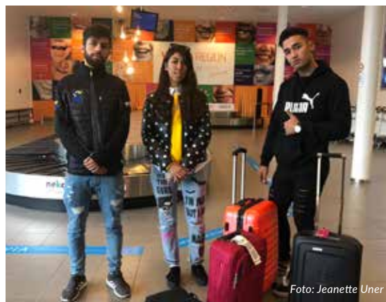
Våra unga ledare i Ny på landet kryddar konferensen i Finland som handlar om integration på landsbygden i 4 europeiska länder.