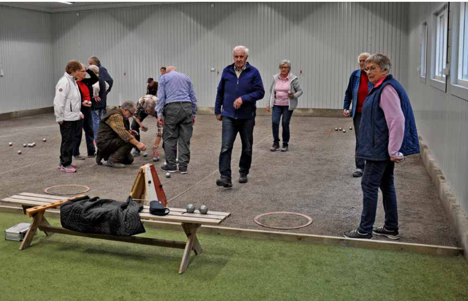
Boulespel pågår. Hallen är välbesökt och stämningen är mycket bra.

En inomhushall för boulespel och andra aktiviteter var efterlängtat och blev direkt välbesökt. Multiarenan vid badet blev också en populär anläggning. En bok om Hannäs har också gjorts, fast i ett annat projekt.