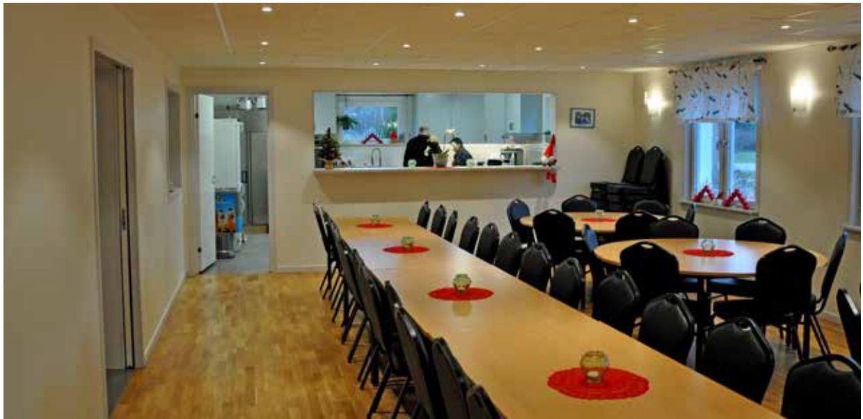
Tillbygganden från samlingsalen med köket längst bort i bild.

Att göra något åt byggnaden har länge varit i tankarna men det skulle dröja några år innan en tillbyggnad blev möjlig.