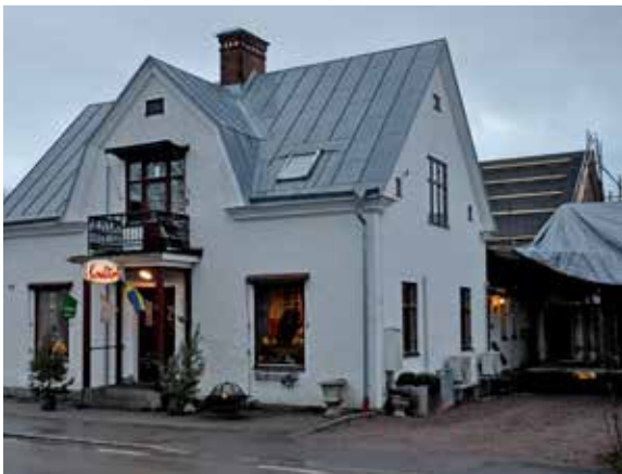
Väderstad Centralkonditori. Det nya huset och blivande entrén syns till höger.

– Nu blir det bättre med genomflödet i och med nya ingången. Hela entrén blir annorlunda, flödet.