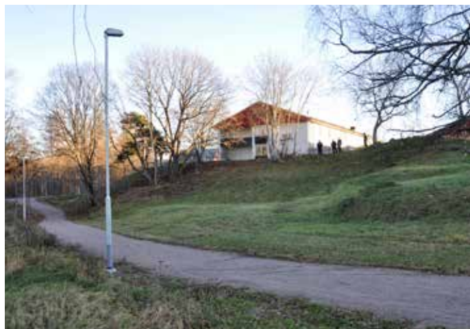
Pulkabacken sedd från gångvägen. Belysningen längs vägen är på plats.

– Utan stöd hade vi aldrig kunnat göra det här.