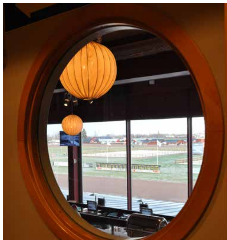
De nya ridbanorna inne i travovalen sedda från restaurangen.

– Om det blir kombinerad defileringsvolt och islandshästoval så blir islandshästovalen lite större och den första belysta islandshästovalen i Sverige.