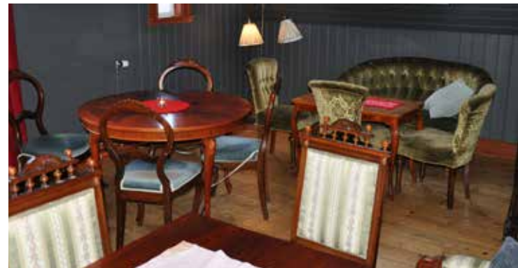
Interiörerna i konditoriet är som någons vardagsrum.

– Vi vill skapa glädje för oss, våra anställda och våra gäster.