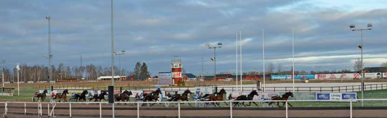
De nya ridbanorna inne i travovalen.

– Materialet på banorna ska kunna ligga tio år. Däremot behöver vi personal som vattnar och så. Det är sand med fibertrådar, små tygbitar i den så kallade fiber-sanden. Som tävlingsunderlag är det utmärkt.