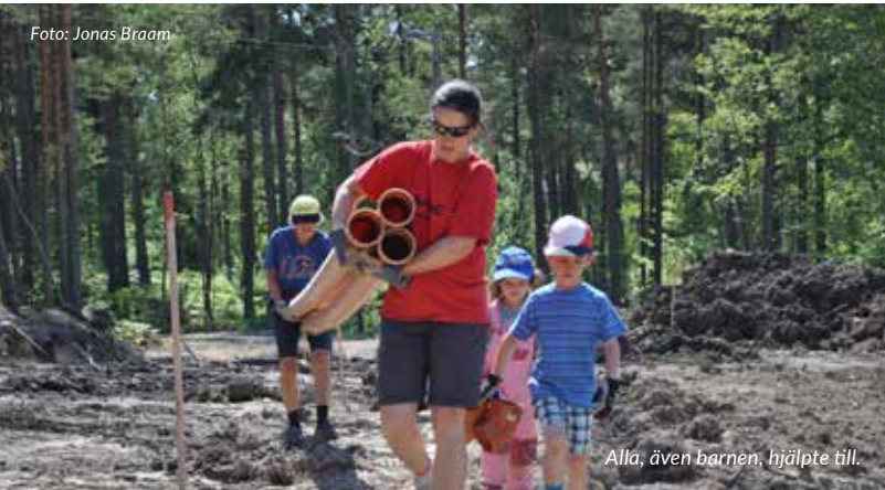
Alla, även barnen, hjälpte till.