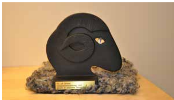
Ullbaggepriset i kategorin Integration på den nationella Landsbygdsgalan 2017.

Ny på landet belönades med det fina Ullbaggepriset i kategorin Integration på den nationella Landsbygdsgalan 2017. År 2019 var Ny på landet ett av de tre svenska projekt som nominerades till Rural Inspiration Awards som arrangerades i samband med att det Europeiska Landsbygdsnätverket tioårsjubileum. Ny på Landet nominerades i kategorin Social inclusion.