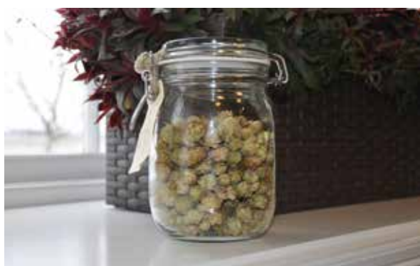
15 gram humle.

– Vilka sorter kan man odla här i Östergötland och hur gör man? Det är en liten kunskap som försvunnit. Förr kunde alla odla. Nu är det ingen som vet. Hur får man det att bli kommersiellt storskaligt?