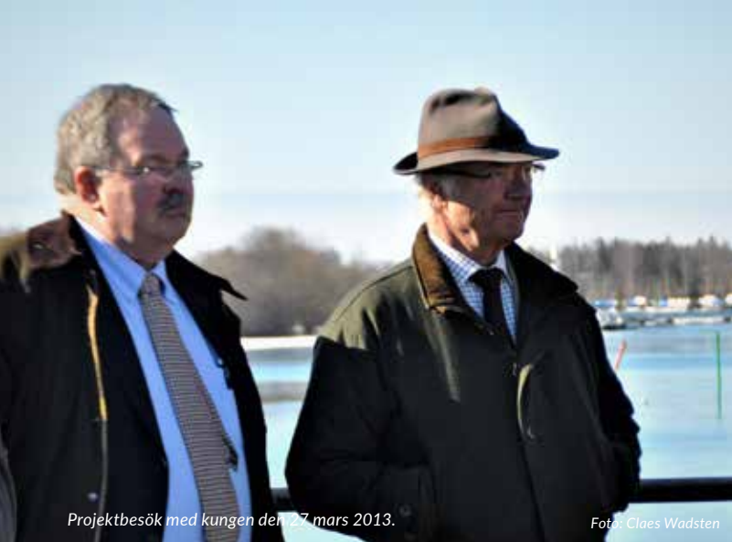
Projektbesök med kungen den 27 mars 2013.