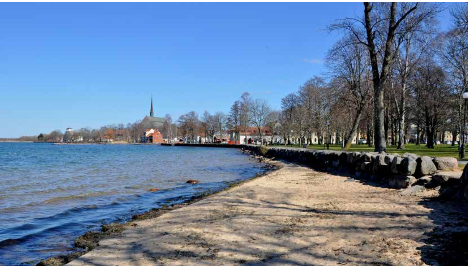
Pittoreska medeltidsstaden Vadstena.

I Vadstena finns en mycket stor potential för turism. Här finns mer än den pittoreska medeltidsstaden. Landsbygden runt om erbjuder mycket för turister. Nu samordnas marknadsföringen för såväl inrikes som internationell turism.