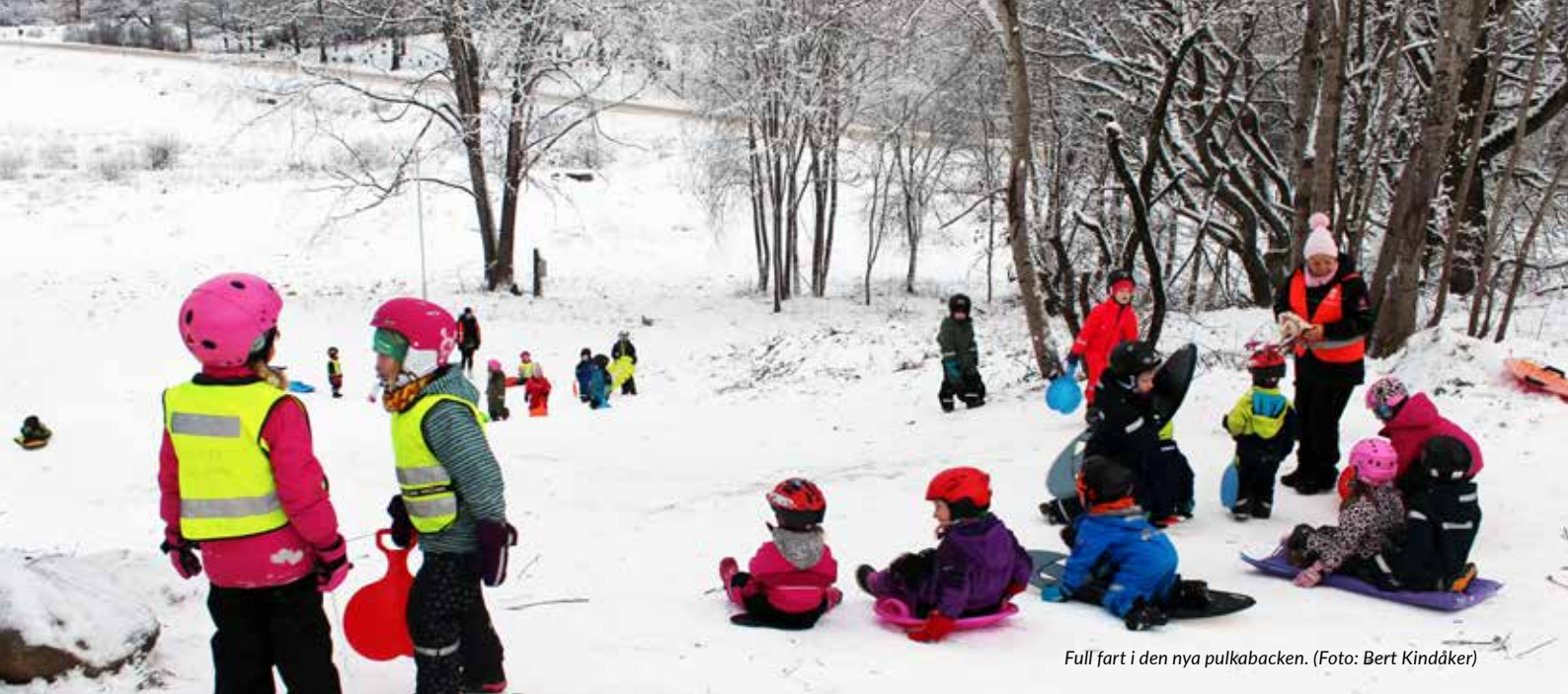
Full fart i den nya pulkabacken.

gamla gångvägen, nedanför backen, som var vedertagen gångväg och närmaste vägen till busshållplatsen för de som bor där borde få belysning.