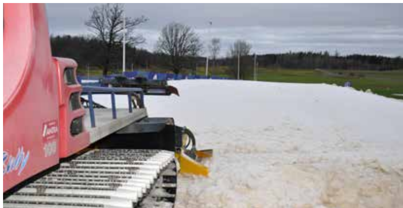
Konstsno är en avgörande del i verksamheten.