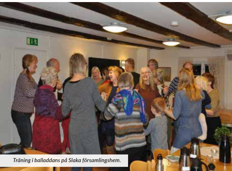
Träning i balladdans på Slaka församlingshem.