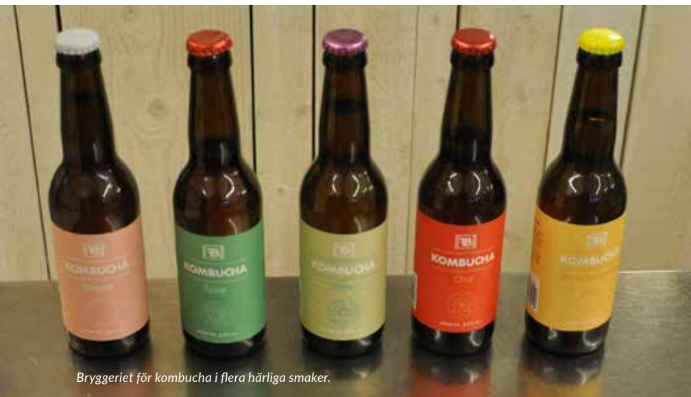
Bryggeriet för kombucha i flera härliga smaker.