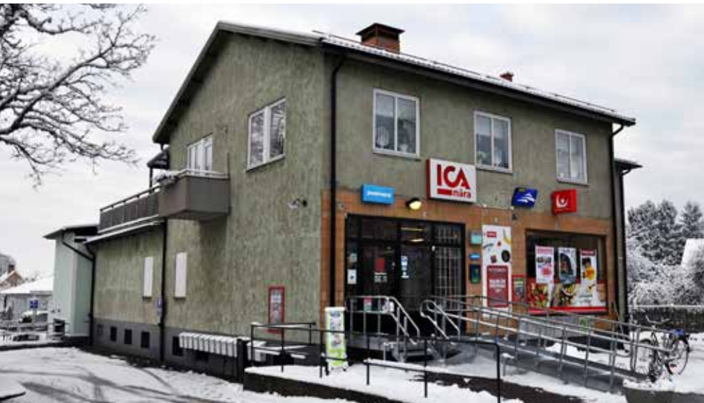
Matbutiken i Tjällmo har öppet alla dagar i veckan året runt.