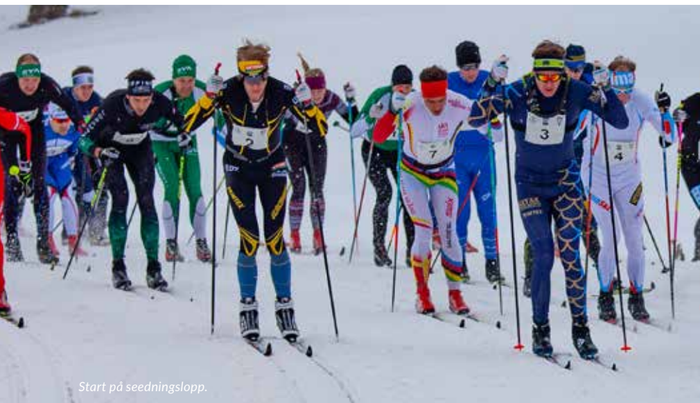
Start på seedningslopp.