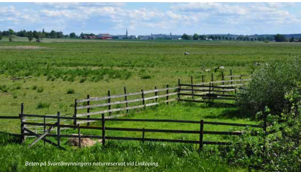
Beten på Svartåmyningens naturreservat vid Linköping.