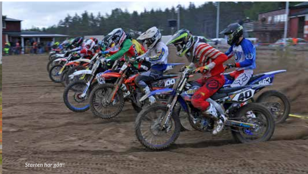
Starten har gått!

Motocross och enduro är sporter där säkerheten måste vara på topp. Antalet funktionärer som behövs är stort. Av dessa behöver flertalet vara utbildade och att få fler som är det var målet med projektet.