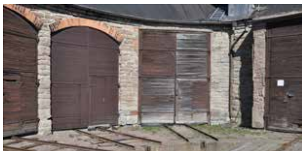
En gammal miljö har bevarats ganska intakt. Allt finns kvar på stationen i Vadstena. Stationshus, lokstallar, rälsbussgarage, godsmagasin med mera.

– Vi fick ett föreläggande om att byta rätt mycket sliprar som vi nästan klarade av.