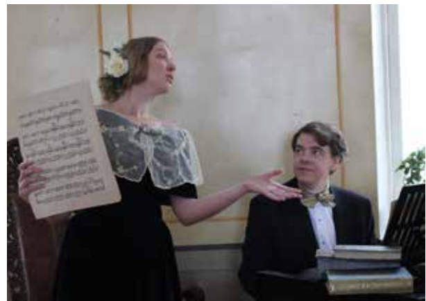
Jenny Lind sjunger ackompanjerad av Adolf Fredrik Lindblad.

Många är delaktiga i projektet eller snarare projekten. En del är anställda medan andra prövar sin arbetskapacitet. Handledare finns. Mycket förenklat är projektet som syftar till ett samarbete mellan den lokala hembygdssföreningen,