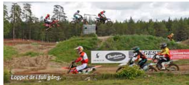
Loppet är i full gång.

– Även förare ska ju ha den utbildningen.