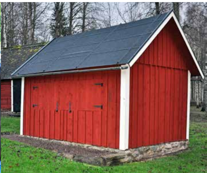
Kiosken när den inte är öppen.

På hembygdsgården i Väderstad var kiosken i behov av upprustning. Det handlade bland annat om att få en bättre arbetsmiljö för de som sköter kiosken. Byggnaden åtgärdades i sin helhet.