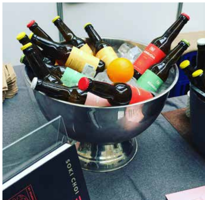
"Finspångs Kombucha ska växa långsamt från fritid till att producera en högkvalitativ och smakfull dryck som efterfrågas både som måltidsdryck och stilldrink på samma sätt som juice, läsk och öl idag."

– Jag kan inte expandera nu men jag är nära ett vägskal.