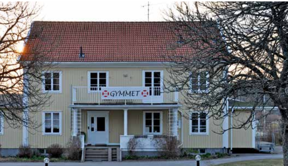
Man tar inte fel på hus. Gymmet står det och så heter det.