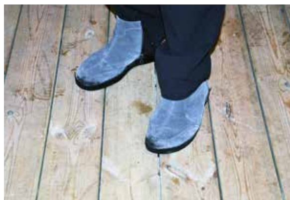
En stor förbättring är att den nu finns riktigt golv i kiosken.

- Det har blivit väldigt mycket bättre för de som jobbar i kiosken och även för de som kommer och handlar. Kiosken ser betydligt trevligare ut på utsidan och även invändigt när man tittar in.