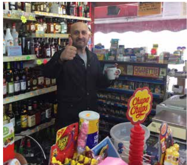
Sortimentet vid kassan är mycket annorlunda än här.