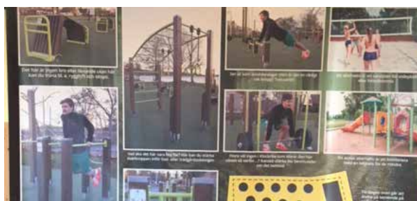
På en stor duk beskrevs vad marken kunde användas till.

– Under trevliga former kunde folk titta på utställningen, fika och fylla i lapparna. Det blev ett 100-tal klockrikebor som lämnade sina önsknings.