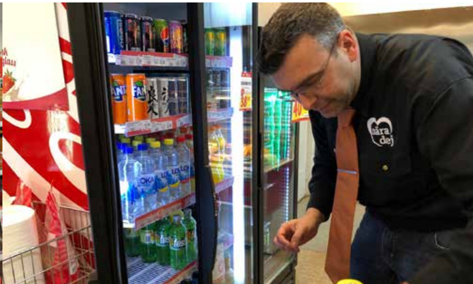
Utbytesprogrammet ger insikter och inspiration. Pepparkvarnen har nu haft en handlare från Grekland på besök i butiken.

I lanthandeln Pepparkvarnen i Grebo genomförde man en givande och inspirerande studieresa till Londons utkanter. En naturlig utveckling blev ett utbytesprogram så nu har en grekisk handlare praktiserat i Grebo.