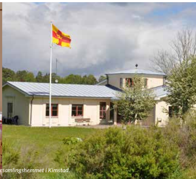
Församlingshemmet i Kimstad.

Kulturlivet i mindre samhällen kan vara torftigt. Det vill säga om där inte finns ett byalag eller liknande som tar itu med saken. I Kimstad spelades teaterföreställningen Jord genom initiativ från byalaget som värnar även om kulturlivet.