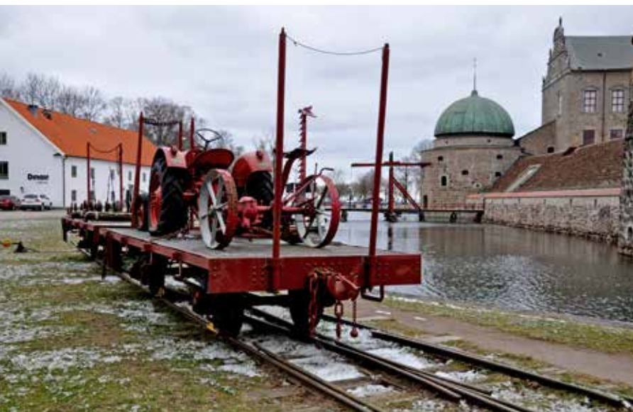
Det fanns ett antal orter runt Vättern som hade hamnspår så man kunde lasta om mellan tåg och fartyg men det är bara Vadstena som har kvar dessa hamnspår.