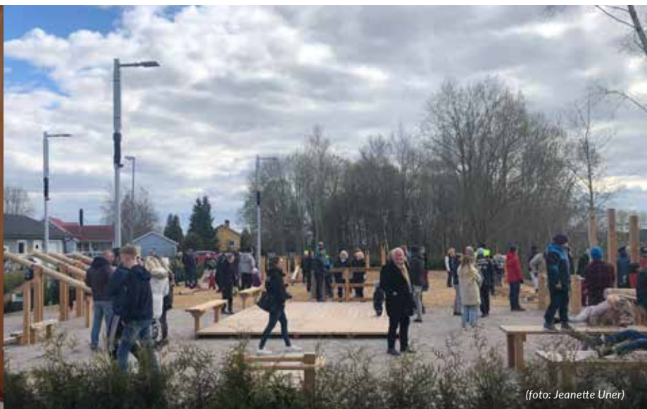
Utegygmet vid invigningen.