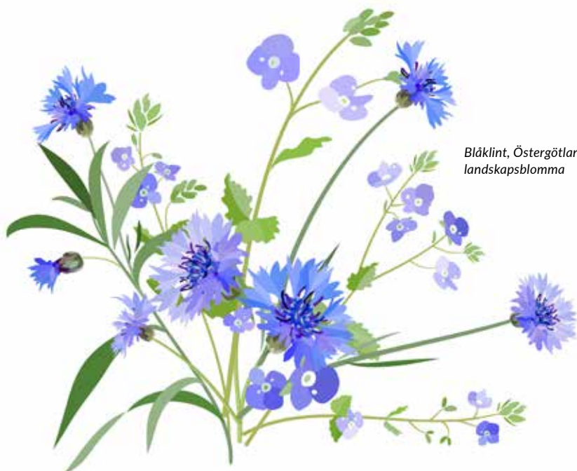
Blåklint, Östergötlands landscapsblomma