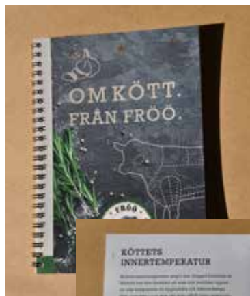
Skriften "Om kött från Fröö".

Innehållet är trevligt och pedagogiskt presenterat.