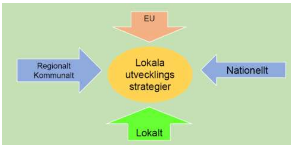
Illustration 1. Kopplingen mellan lokal förankring och EU

Ideella föreningar har också haft möjlighet att framföra synpunkter direkt i möten och via enkät. Via ungdomsenkäten har också föreningarnas aktiva idrottare fått möjlighet att framföra önskemål om både personlig utveckling och utveckling i närområdet man lever i.